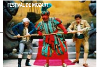
FESTIVAL DE MOZART

del 15 de junio al 26 de julio. En él se representa una selección de las mejores obras de Mozart, con música sinfónica y de cámara. Así, destacan las óperas Las bodas