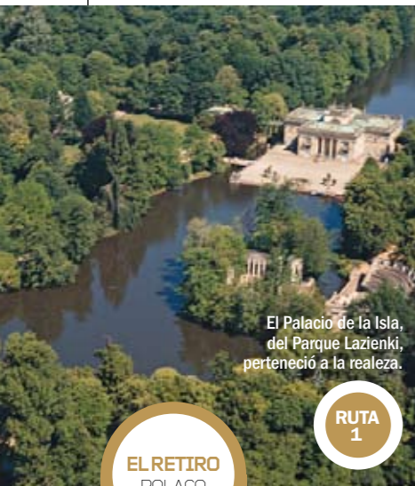
El Palacio de la Isla, del Parque Lazienki, perteneció a la realeza.